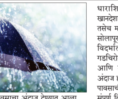
हलक्या पावसाचा अंदाज देण्यात आला. रिववारी मराठवाडातील छत्रपती संभाजीनगर, जालना, परभणी, हिंगोली,

पुणे । प्रतिनिधी राज्यातील अनेक भागात पावसाचा अंदाज हवामान विभागाने दिला. शनिवार ते सोमवार पावसाचे प्रमाण जास्त राहील. सोमवारी विदर्भ, मराठवाडा आणि मध्य महाराष्ट्रातील काही जिल्हांना येलो अलर्टही देण्यात आला.