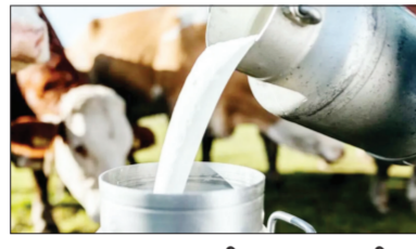
आयुक्तालयाकडून जारी करण्यात आली

आहे. राज्यात शेतकऱ्यांना गायीच्या दुधाला योग्य दर मिळत नसल्याने, डिसेंबर महिन्यात दूध उत्पादक शेतकऱ्यांनी राज्यभर आंदोलन उभारले होते. त्यानंतर जानेवारी महिन्याच्या सुरुवातीला शेतकऱ्यांना गायीच्या दुधाला प्रति लिटर ५ रुपये अनुदान देण्याचा निर्णय घेण्यात आला होता. त्यानुसार शेतकऱ्यांना