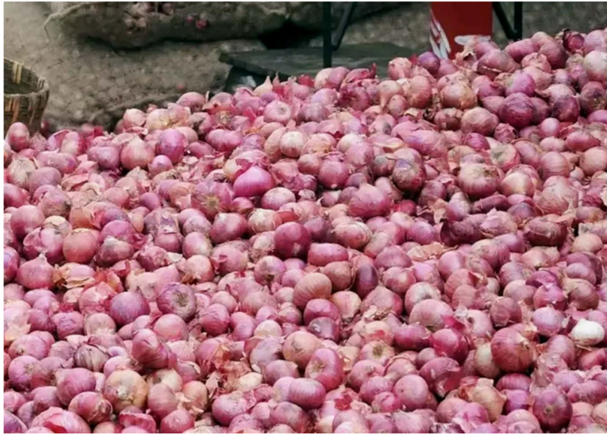
करण्यात आले आहे. तर याआधी केंद्रीय गृहमंत्री समितीने (१८ फेब्रुवारी २०२३) कांदाच्या अमित शाह यांच्या अध्यक्षतेखाली मंत्रांच्या निर्यातीला मंजुरी दिली होती. याप्रमाणे केंद्र सरकारने

दरम्यान देशातील कांदाच्या वाढत्या किमतींवर नियंत्रण मिळवण्यासाठी ८ डिसेंबर २०२३ रोजी सरकारने कांदाच्या निर्यातीवर बंदी घातली होती. तसेच ३१ मार्चपर्यंत कांदाची निर्यात बंदी कायम राहिल, असे स्पष्ट केले होते. पण लोकसभा निवडणुका घोषित झाल्यानंतर वाणिज्य मंत्रालयाने २२ मार्चला अधिसूचना काढत कांदावरील निर्यातबंदी पुढील सुचनेपर्यंत अशोच राहिल असे जाहीर केले. वाणिज्य मंत्रालयाने बुधवारी (ता. ०३) कांदा निर्यातीबाबत अधिसूचना काढली. यात युएईला अतिरिक्त १० हजार टन कांदा निर्यात केली जाईल, असे स्पष्ट केले आहे. तसेच ही निर्यात नॅशनल कोऑपरेटिव्ह एक्सपोर्ट्स लिमिटेड मार्फत करण्यात येईल, असेही अधिसूचनेत स्पष्ट